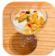
セット グラノーラヨーグルト